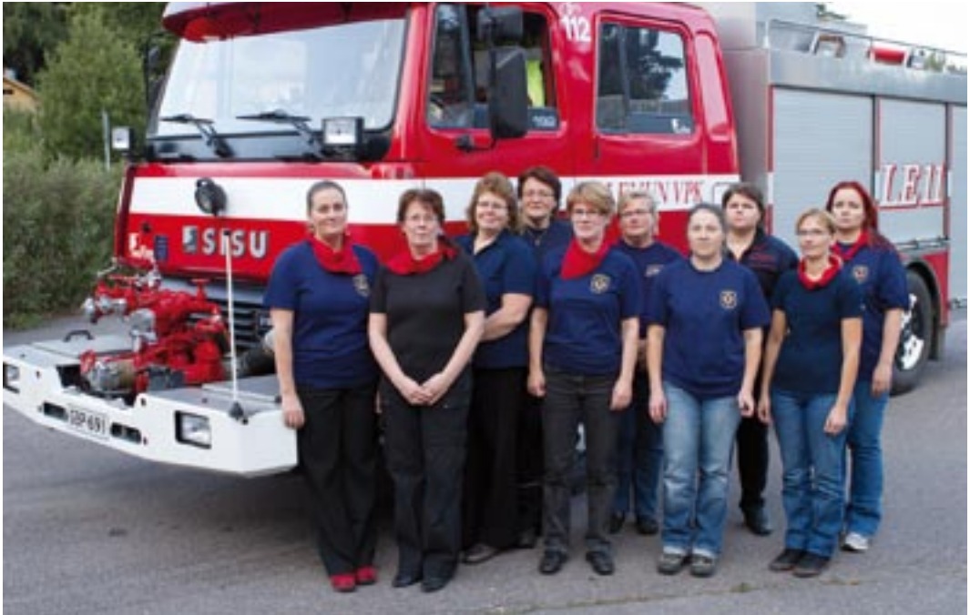
VPK:n naisosasto.

taidoissa, koulutusta ja varsinkin 2000-luvulla kursseja esimerkiksi ensiavusta.