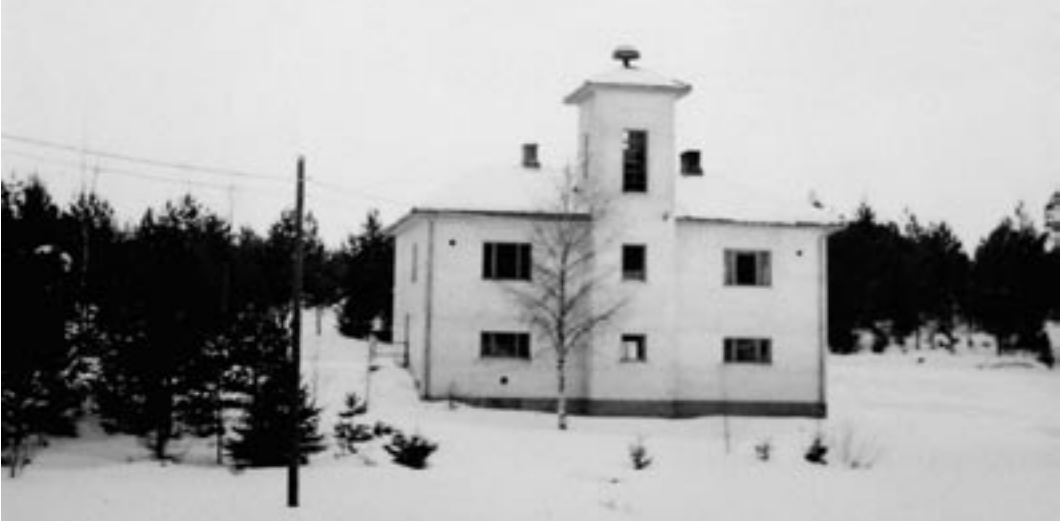
Lemun paloasema vuoden 1949 asussa.