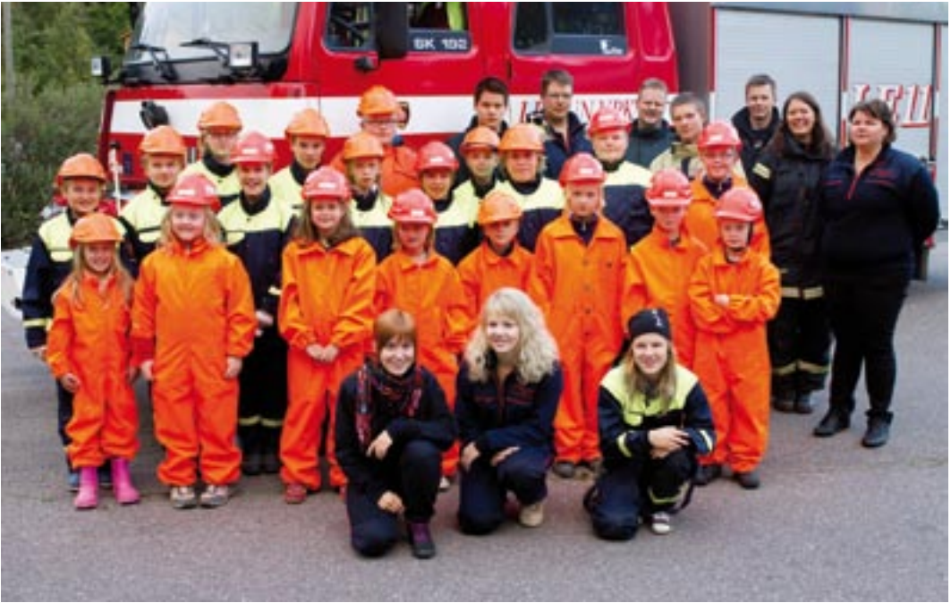
VPK:n nuoris-osasto kouluttajineen.