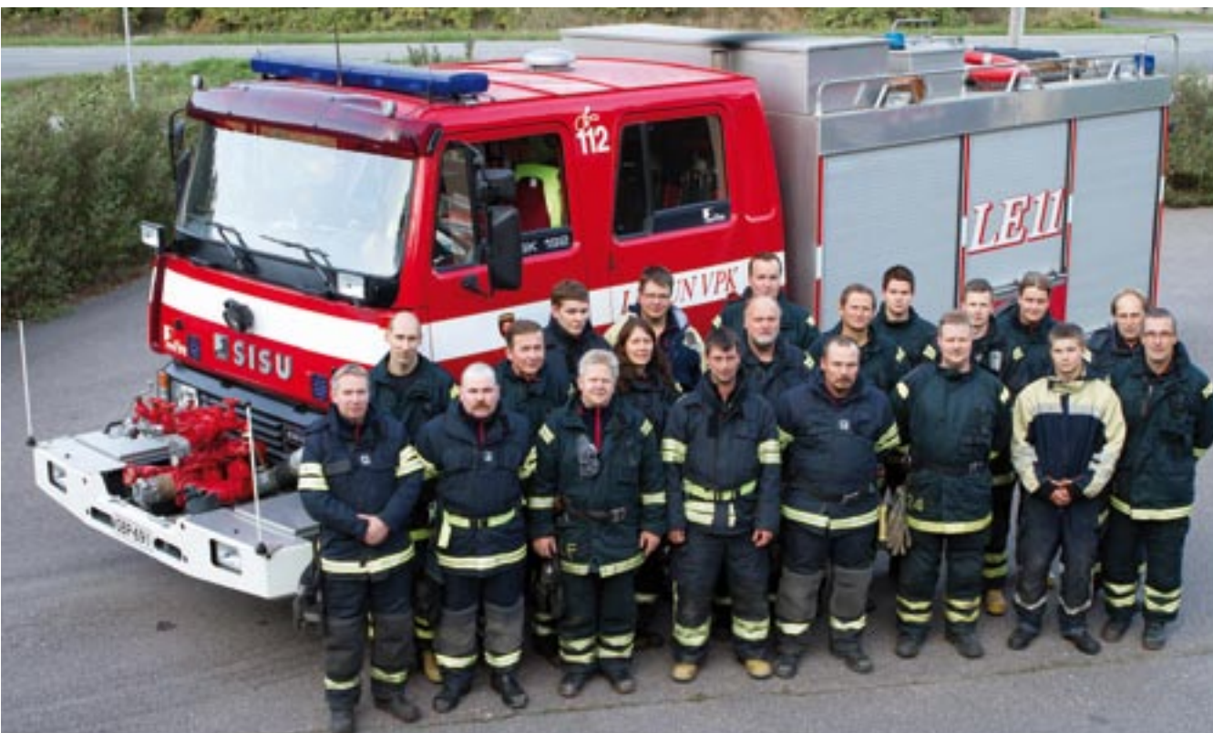
VPK:n hälytysosasto vuonna 2010. Osaston koko vahvuus on 22 henkilöä.

1950- ja 1960-luvuilla palot olivat useimmiten maasto- ja metsäpaloja, joskus myös navettapaloja, kuten vaikkapa vuonna 1959, kun Haaron tilalla traktorista lähtenyt palo levisi navettaan sillä seurauksella, että irtaimen ohella paloi myös eläimiä. Asuntopalot olivat kohtalaisen harvinaisia; kuivureita sen sijaan sam-