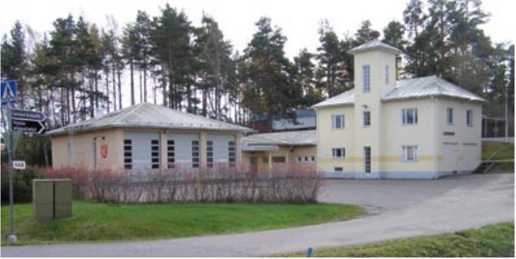
Lemun paloasema vuoden 1997 laajennuksen jälkeisessä nykyasussa.

mulla ja Askaisilla oli lisäksi yhteinen palopäällikkö ja palotarkastaja.