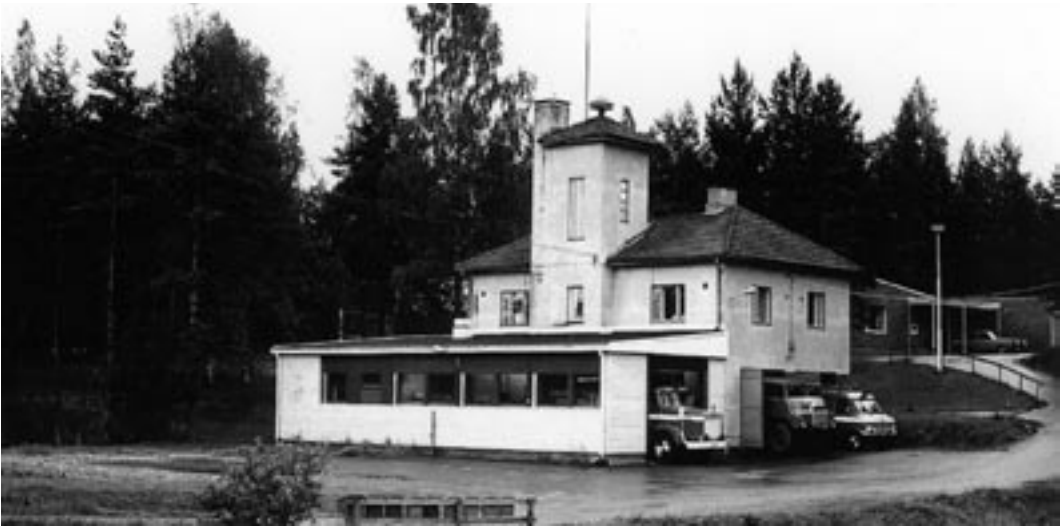
Paloasema sai lisäsiiven vuonna 1975.

alueilla ammattitaitoisten vetäjiensä johdolla. Aktiivipalomiesten joukossa on myös monien alojen ammattimiehiä, jotka ovat pystyneet hyödyttämään palokuntaa omalla osaamisellaan. Tukena on samoin ollut tiivis yhteistyö Lemun kunnan kanssa ja vuodesta 2004 Aluepelastuslaitoksen kanssa.