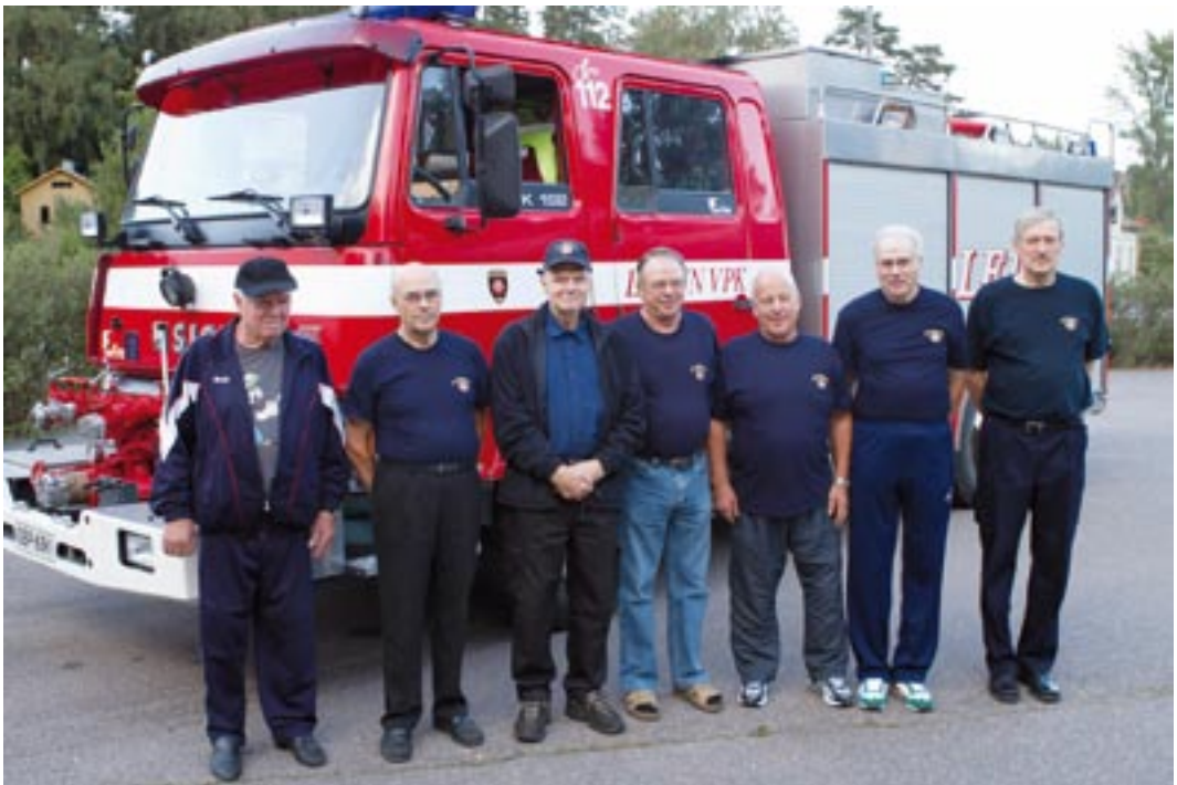
VPK:n veteraaniosasto.

Veteraanien ominta alaa on ollut monenlainen ennaltaehkäisevä työ. He ovat esimerkiksi myyneet palovaroittimia, sammutuspeitteitä, sammuttimia ja liukuesteitä. Suoranaista kulttuurityötä veteraanit ovat tehneet kunnostaessaan VPK:n vanhinta kalustoa käyttökuuntoon, vuodesta 2008 käytössä on ollut yhdis-