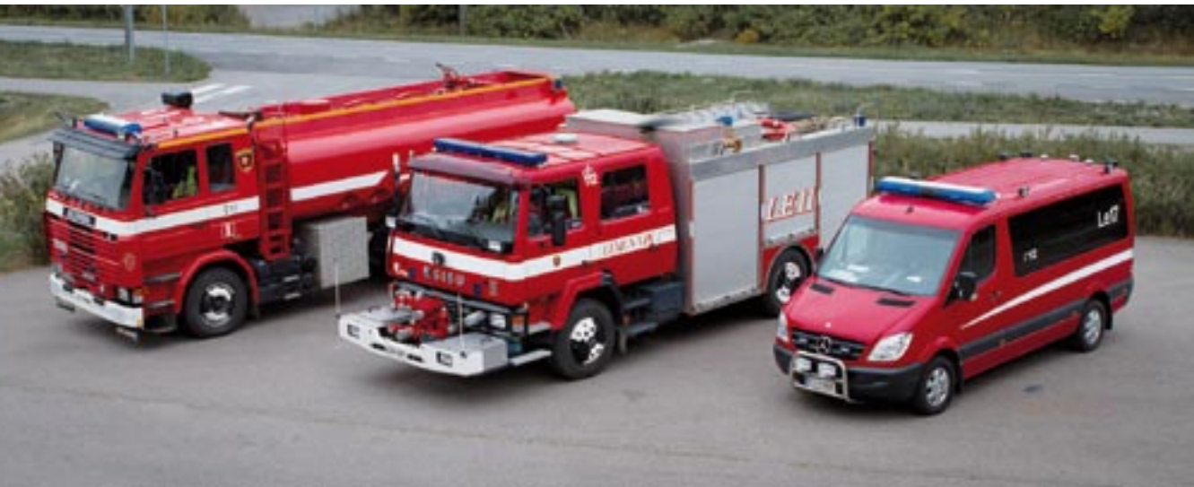
Lemun VPK:n käytössä oleva kalusto vuonna 2010: säiliöauto LE13 Scania, sammutusauto LE11 Sisu ja miehistöauto LE17 Mercedes.

kuntoon nähden, että Sisua ei hankittu. Lemun VPK osti kuitenkin samana vuonna Kaksikerran VPK:lta kolarivaurioituneen Volvo F7 –paloauton Turun Palolaitoksella hintaan 3400 euroa. Autossa oli hydraulikäyttöinen palopumppu, jonka VPK irrotti. Auto itse myytiin eteenpäin Koivulan autohajottamolle. Palopumppu ja pumpun hydraulinen käyttöjärjestelmä ohjauspaneelieineen jäivät siis Lemun VPK:lle, tosin ne jatkoivat sittemmin matkaa Liedon VPK:n käyttöön.