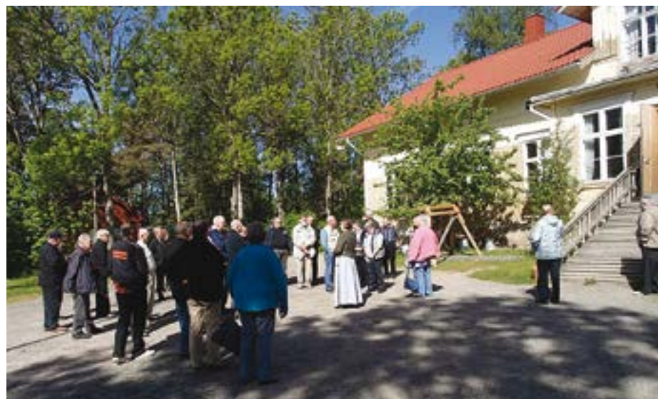
Lemun VPK:n ja naapuripa- lokuntien veteraanit retkellä Sa- galundissa.