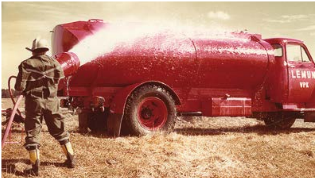
Säiliöauto Bedford J6, Lemun VPK:lla käytössä 1972-1980.

Kaluston suhteen suuria muutoksia Lemun VPK:ssa ei ole tapahtunut. LE17 eli oma miehistönkuljetusauto Mercedes Benz Sprinter vuodelta 2009 on edelleen hyvässä kuosissa, vaikka takana on hirvikolarikin, johon se joutui melkein tuoreeltaan. Sammutusauto LE11 on vanha kunnan Sisu vuodelta -95 eli takana on jo 20 vuotta hälytysajoa. Veteraanit ovat hiukan paikkailleet maalivaurioita, ja vuosia on vielä edessäpäinkin. Säiliöauto LE13 on Someron VPK:lta kierrätetty ja vuonna 2008 käyttöön otettu Scania, alunperin vuosimallia 1987.