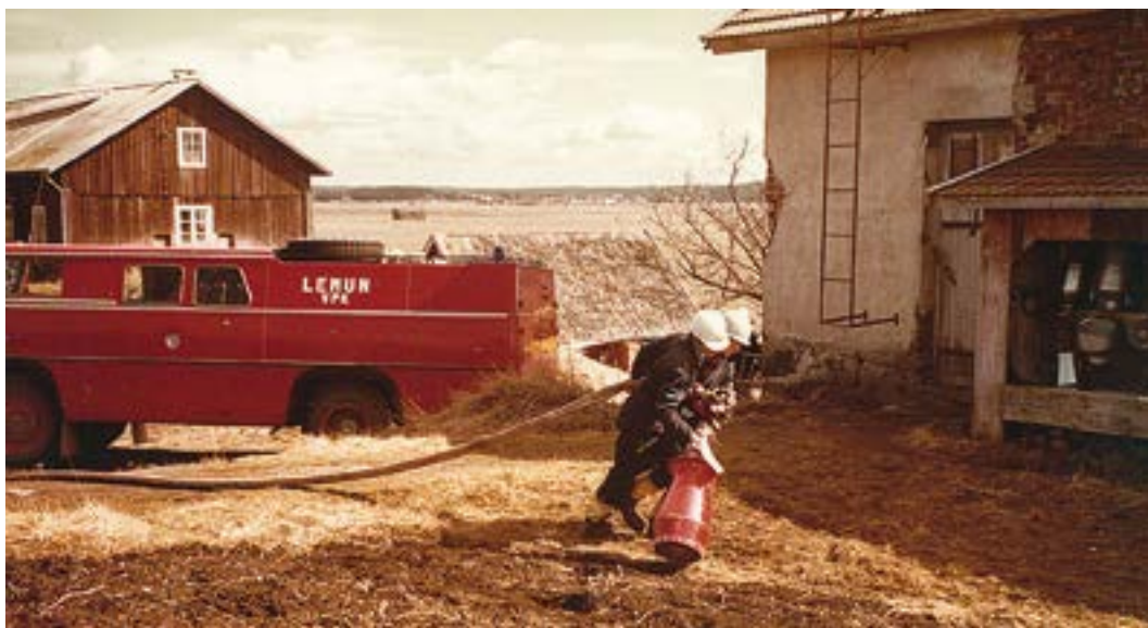
Sammutusauto Bedford, Lemun VPK:lla käytössä 1962-1995.

Kaluston suhteen suuria muutoksia Lemun VPK:ssa ei ole tapahtunut. LE17 eli oma miehistönkuljetusauto Mercedes Benz Sprinter vuodelta 2009 on edelleen hyvässä kuosissa, vaikka takana on hirvikolarikin, johon se joutui melkein tuoreeltaan. Sammutusauto LE11 on vanha kunnan Sisu vuodelta -95 eli takana on jo 20 vuotta hälytysajoa. Veteraanit ovat hiukan paikkailleet maalivaurioita, ja vuosia on vielä edessäpäinkin. Säiliöauto LE13 on Someron VPK:lta kierrätetty ja vuonna 2008 käyttöön otettu Scania, alunperin vuosimallia 1987.